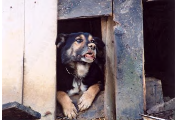
Zdiagnozowany w 2012 r. w pow. rzeszowskim przypadek wścieklizny u psa (postać szalowa)

Wyróżnia się 2 postaci choroby: agresywną (szałową) i cichą (porażenną).