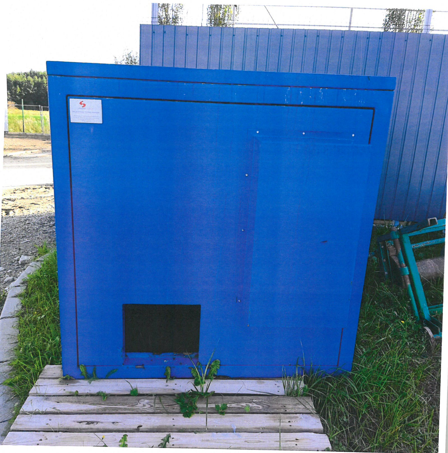
Ostona dźwiękochłonna dmuchawy j/w, rok budowy 1997, wymiary około: szerokość 1,32 m, długość 2,0 m, wysokość 1,35 m